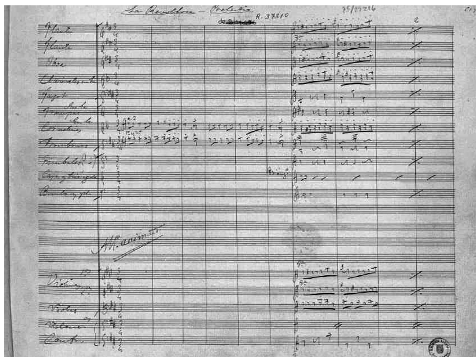
Figura 2. Autógrafo del comienzo del preludio de La Revoltosa de R. Chapí, 1897 39 .

Ya en 1900, en el Teatro Principal de Ciudad Rodrigo se representaban La zarina , Don dinero y La mujer del molinero con todas las localidades llenas 40 y así continuaron las representaciones prácticamente cada año, intensificándose en Carnaval, ferias y alguna otra ocasión en que las compañías estaban actuando en Salamanca y había cierta facilidad en que se desplazasen a Ciudad Rodrigo.