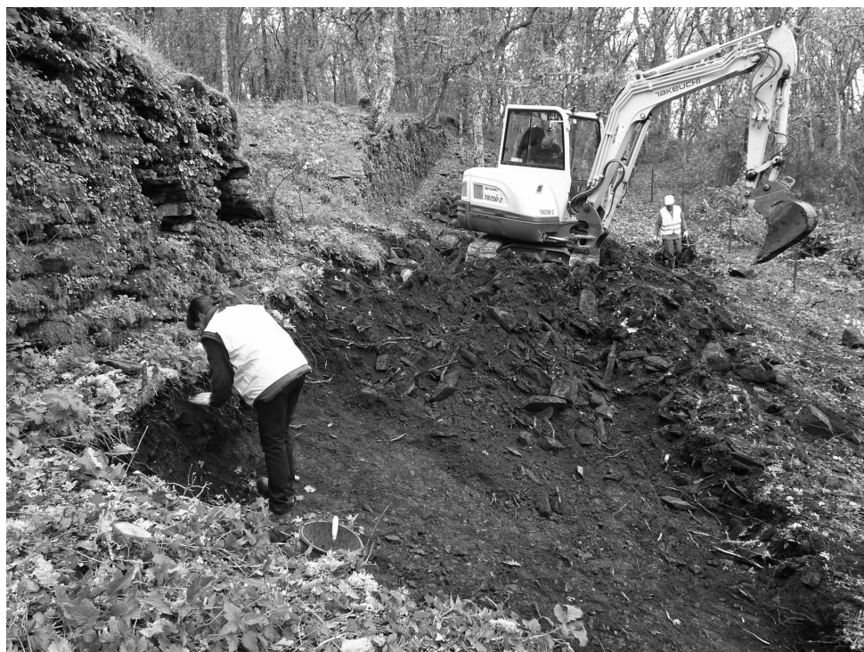
Figura 2. Transcurso de los trabajos de desescombro, con ayuda de una pequeña pala excavadora giratoria, previos a la limpieza y excavación manual de este espacio extramuros.

fue liberando de derrumbes el espacio, pero dejando un pasillo o escalón paralelo al paramento de la muralla de en torno a medio metro, para desmontarlo más tarde manualmente. Tampoco se llevó a cabo el vaciado de los niveles de base sobre el sustrato natural de pizarras, pues una vez que éste afloró, a cota variable de entre -0,30 y -1,00 metro con respecto a la cota del terreno, se le indicó al palista que subiera la cota del vaciado algunos centímetros para poder proceder más tarde a una excavación manual. El volumen de derrumbes más potente se constató, como era previsible, en la zona central del tramo, donde se apreciaba la brecha, alcanzando aquí una potencia superior al metro y medio. A ambos laterales de la brecha el derrumbe era menor, si bien aumentaba en dirección suroeste, alcanzándose también alturas de en torno al metro. En términos generales el volumen de derrumbes retirado de la cata supuso en torno a 35 metros cúbicos, según quedó dicho.