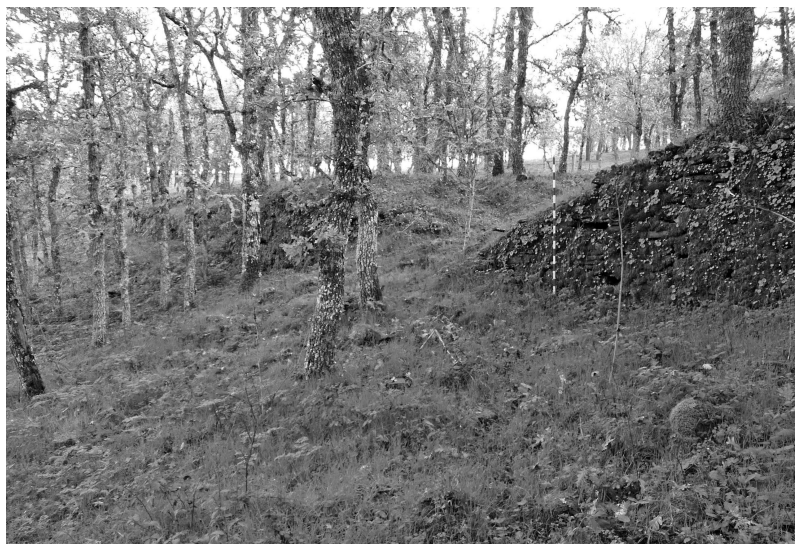
Figura 1. La brecha en la muralla y el derrumbe que ocultaba parcialmente la construcción defensiva. Vista desde el exterior, poco antes de comenzar la actuación arqueológica.

En la zona del trazado de la muralla donde se ha actuado era visible antes de la intervención un desplome de sus fábricas que había formado una brecha, cuya anchura exacta resulta difícil de determinar por la presencia de una densa capa de musgo en los paramentos y de vegetación en el relleno. Diversos investigadores habían supuesto en los últimos tiempos la posible –que no probable– existencia de una puerta o acceso en esta parte del recinto, puerta que podría estar oculta por los derrumbes de la propia estructura defensiva 4 . Dichos derrumbes cubrían totalmente en el espacio de la brecha su paramento exterior. Se trataba de un potente derrumbe de bloques y lajas de pizarra (roca local en la que está construida la muralla) que se identifican claramente con su núcleo o relleno –principalmente– y su paramento exterior. En los laterales se podía observar no sin dificultad, debido a la presencia de musgos y líquenes, el paramento de la defensa, guardando la característica fábrica castreña, es decir en talud y con las piedras que lo conforman bien aparejadas, evitando en buena medida la formación de huecos o amplias juntas entre sí.