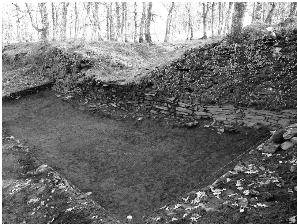
Figura 3. Vista desde el suroeste de la cata y del lienzo una vez desescombrado, de 15,5 metros de trazado. En el centro se observa la brecha y a ambos laterales el paramento de la muralla castreña. La parte inferior del alzado, sin musgo, es la que se encontraba oculta por los derrumbes, habiendo quedado ahora visible.

retirado el potente derrumbe que lo ocultaba, donde la estructura defensiva parece que habría cedido, tal vez por la mala fábrica que se aprecia o quizá fruto de una posterior deficiente reparación.